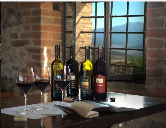
Visita in cantina Banfi