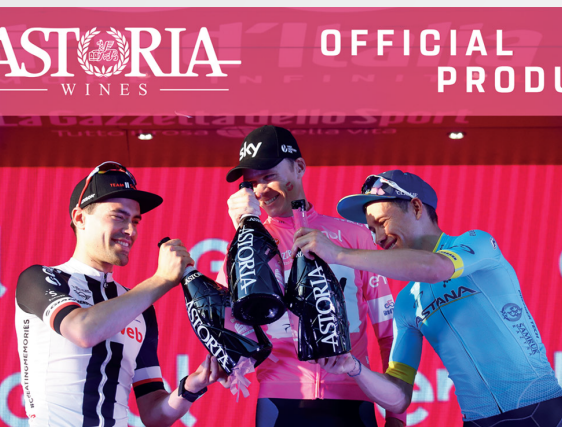
Evento Giro d'Italia Astoria