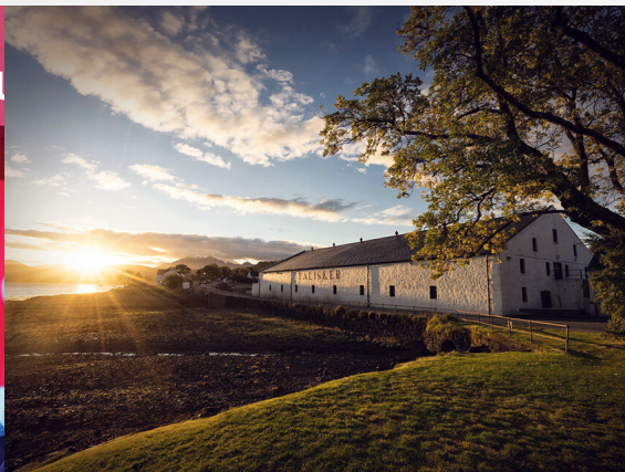
Visita in distilleria Scozia