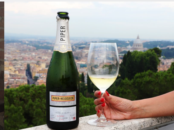
Evento degustazione Piper Heidsieck